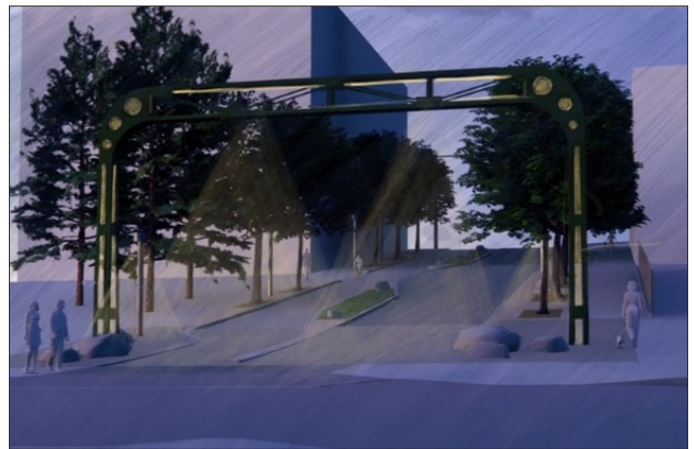
El puente de señales de Alaskan Way Viaduct se iluminará por la noche y servirá de punto de referencia, dando la bienvenida, tanto a visitantes de la zona mejorada, como a quienes viven en Belltown.