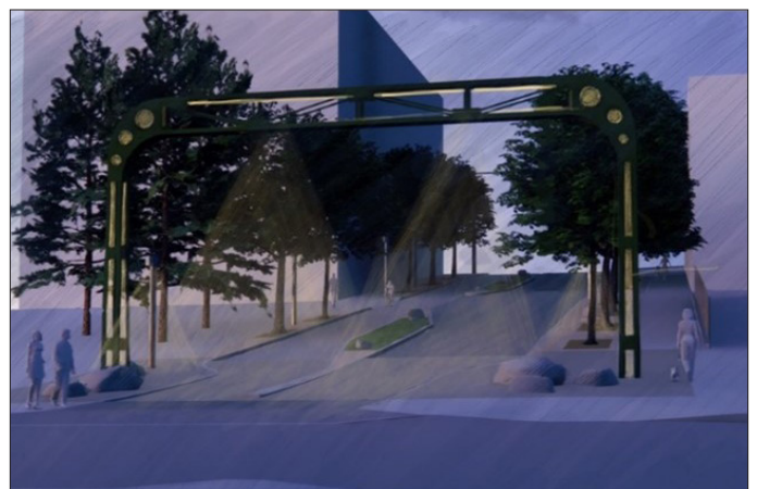
El puente de señales de Alaskan Way Viaduct se iluminará por la noche y servirá de punto de referencia, dando la bienvenida tanto a visitantes de la zona mejorada como a quienes viven en Belltown.