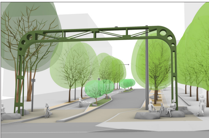
Vista planificada de Bell St, mirando hacia el este en la intersección de Bell St y Western Ave.

Las mejoras dan prioridad a la seguridad, el acceso y la movilidad de los peatones y ciclistas. El proyecto incorporará una ciclopista protegida de doble sentido, ampliará las aceras, añadirá asientos con vistas a Elliott Bay y al Seattle Waterfront y aumentará la vegetación a lo largo del corredor de dos cuadras. El proyecto también incorpora el histórico puente de señales de Alaskan Way Viaduct, que estará iluminado y servirá de entrada al vecindario de Belltown.